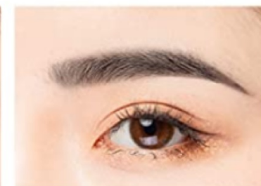
4. Rajzolja meg szemöldökeit a keskenyebb részekben.