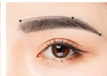
2. A toll hegyével rajzolja a kívánt formára szemöldökei körvonalát.