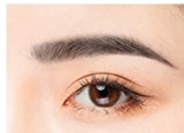
1. Nyírja és fésülje formára szemöldökeit.