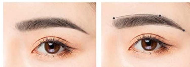
1. Obrvi oblikujte in počešite.