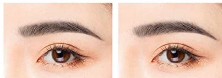
3. Obrvi zapolnite s širšim predelom.