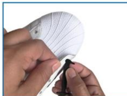
1. Aliniază din exterior capătul șiretului cu gaura de la încălțăminte

În cazul în care există nemulțumiri în ceea ce privește produsul, clientul are 14 zile la dispoziție (de la data primirii produsului) pentru a-l returna și a solicita restituirea banilor, sau înlocuirea cu un produs nou. Retururile și înlocuirile nu vor fi posibile dacă se depășește termenul legal.