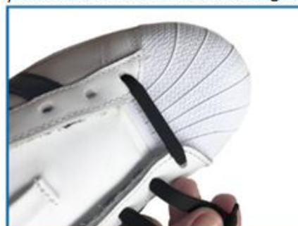
5. După ce ai terminat cu primul șiret, repetă pentru celelalte șireturi