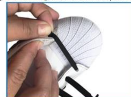
4. Trage celălalt capăt al șiretului pe partea opusă, cu partea texturată în sus