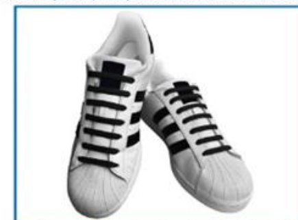
6. Bucură-te de șireturile tale fără legare din silicon!