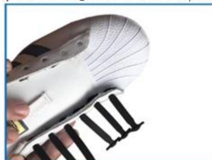
3. Repetă pasul 2 până când toate șireturile au fost introduse în găuri