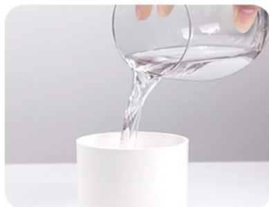
2. Ulijte vodu u spremnik