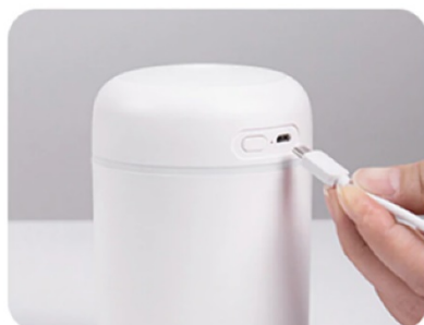
3. Čvrsto pritisnite poklopac i priključite ga na napajanje