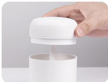
1. Sollevare il coperchio