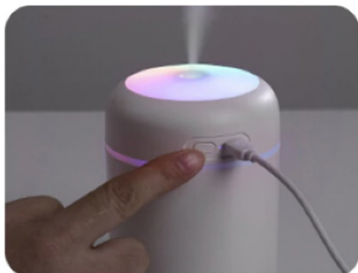
4. Cliccare il pulsante di accensione per avviare l'operazione