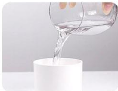
2. Aduagă apă în rezervorul de apă