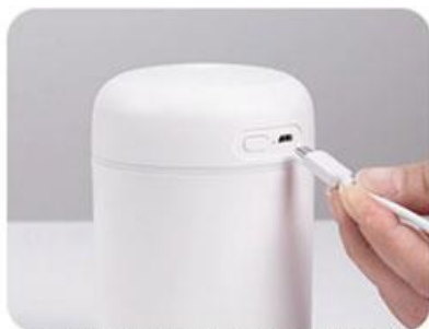
3. Apasă bine capacul și conectează dispozitivul la sursa de alimentare