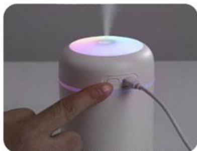
4. Apasă butonul de pornire pentru a începe operațiunea