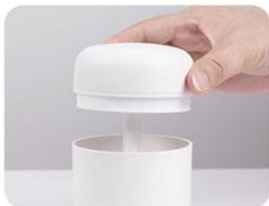
1. Trage capacul în sus